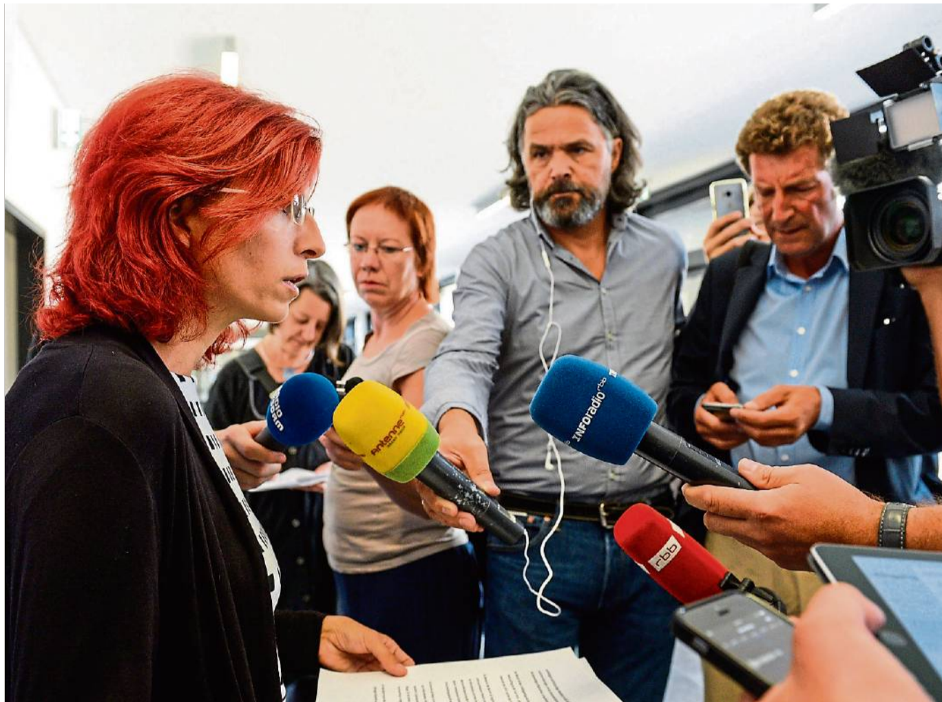
Im Zentrum der Kritik: Nach dem Arzneimittelskandal um Lunapharm in Brandenburg ist Gesundheitsministerin Diana Golze zurückgetreten.

Der CDU-Politiker reagiert damit auch auf die Kritik vieler Experten an dem „schleppenden Rückruf-Verfahren“ im Falle der verun-