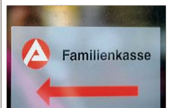
Ab sofort online: Kindergeldanträge für studierende Kinder.

Hintergrund: Beginnt ein Kind nach dem Schulabschluss eine Berufsausbildung oder ein Studium, haben die Eltern in der Regel weiterhin Anspruch auf Kindergeld. wam, AFP