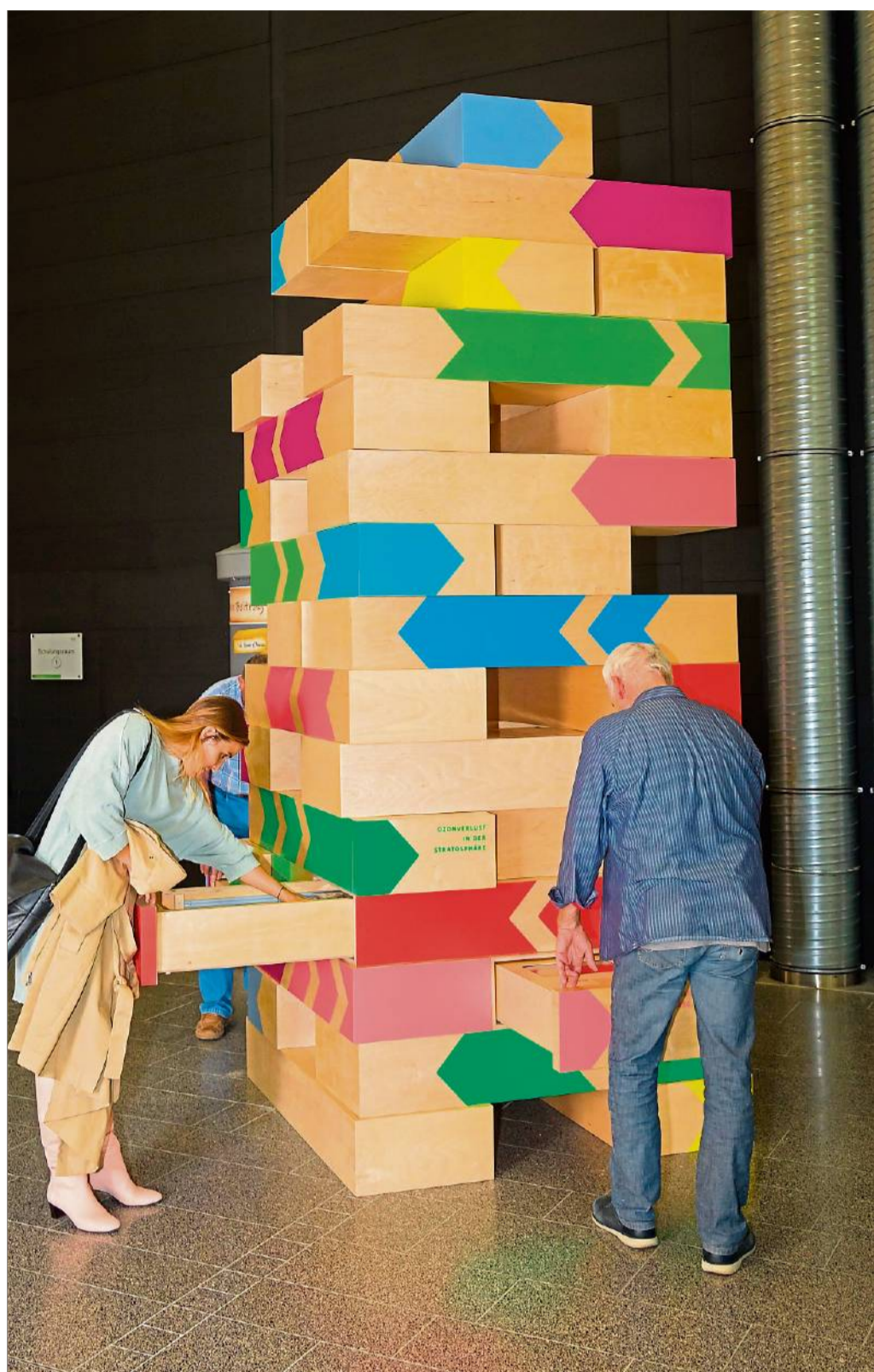
Der überdimensionale Jenga-Turm soll die Umwelt symbolisieren. Auch sie besteht aus Einzelteilen. Fehlen mehrere von ihnen, droht sie zusammenzuberechnen.

OSNABRÜCK Ein Hybridfahrzeug des Typs Toyota RAV 4 in der Farbe Azuritblau-metallic wurde in der Nacht von Montag zu Dienstag von unbekannten Tätern an der Carla-Woldeering-Straße in der Dodesheide entwendet. Das Benzin/Elektro-Auto mit der auffälligen Lackierung und dem Kennzeichen OS-W 5070 war unter einem Carport abgestellt. Die Polizei erbittet Hinweise an Tel. 05 41/327-22 15.