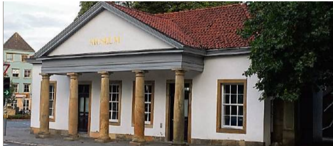
Als „MQ4“ ist das alte Zollhaus heute ins Museumsquartier integriert.

Mehr Beiträge unserer Serie „Zeitreise“ lesen Sie im Internet auf noz.de/osnabrueck