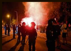
Heidenau, August 2015 Ein rechter Mob randaliert drei Nächte in Folge vor einem Flüchtlingsquartier. 30 Beamte werden durch Steine und Böller verletzt.