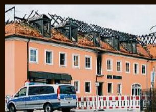
Bautzen, Februar 2016 Fremdenfeindliche Gruppen bejubeln den Brand in einer geplanten Flüchtlingsunterkunft - und behindern die Löscharbeiten.