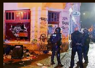
Leipzig, Januar 2016 Hooligans und Rechtsextreme überfallen mit Äxten, Eisenstangen und Holzlaten den links-alternativen Stadtteil Connewitz.