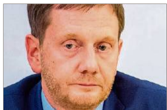
Michael Kretschmer

Wie haben die Hooligans so schnell so viele Teilnehmer mobilisiert? In erster Linie sei über die sozialen Netzwerke für Chemnitz mobilisiert worden, heißt es vom Verfassungsschutz. Dort gebe es „kommunikative Strukturen zuhauf“. Die Hooliganzene im Umfeld des Fußball-Regionalligisten Chemnitzer FC sei „besonders mobilisierungsstark“. Zwei Gruppen - „Kaotic“ und „NS Boys“ („New Society Boys“) - hätten für den Montagabend getrommelt. Beide haben in Chemnitz Stadionverbot. Minister-