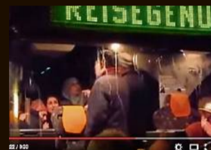
Clausnitz, Februar 2016 Ein Mob blockiert einen Bus mit Flüchtlingen. Die Polizei holt die Migranten gewaltsam aus dem Bus. Dafür erntet sie heftige Kritik.