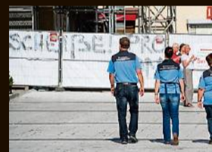
Bautzen, September 2016 80 Rechte und 20 Flüchtlinge gehen mit Flaschen und Steinen aufeinander los. Rechtsextreme treiben die Migranten in die Flucht.