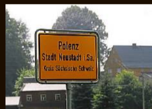
Polenz, Juni 2016 Bei einem Volksfest attackieren drei Rechtsradikale zwei Bulgaren und einen Deutschen mit rumänischen Wurzeln.