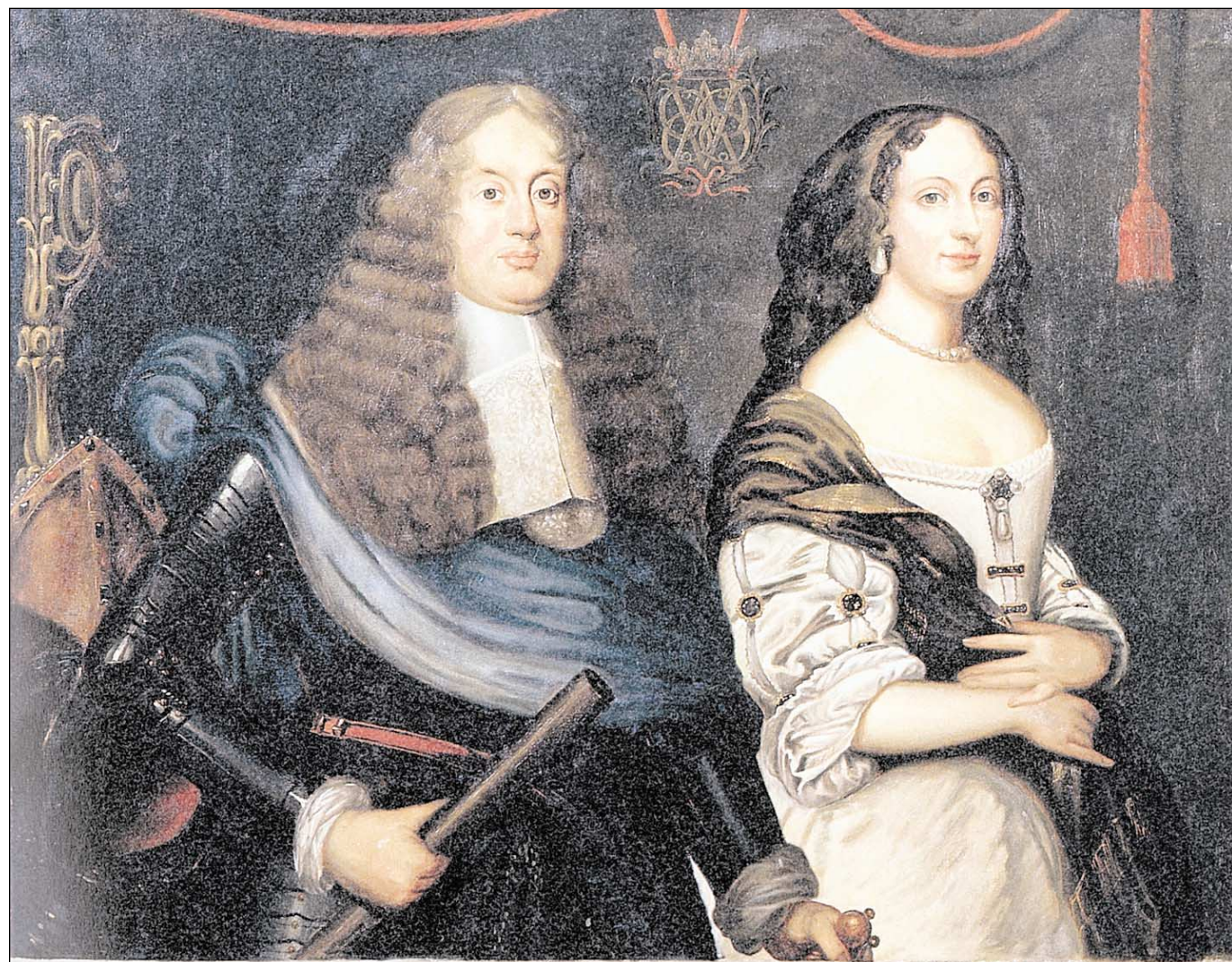
BAROCKES HERRSCHERPORTRÄT: Ernst August I. als Fürstbischof von Osnabrück mit seiner Gemahlin Sophie von der Pfalz. Gemälde aus der Galerie im Rittersaal auf der Iburg, um 1668.